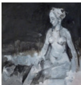
GIUSEPPE BOMBACI REMAKE #2